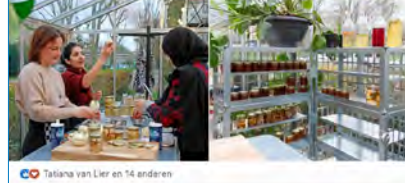
© Talina van Lier en 14 anderen